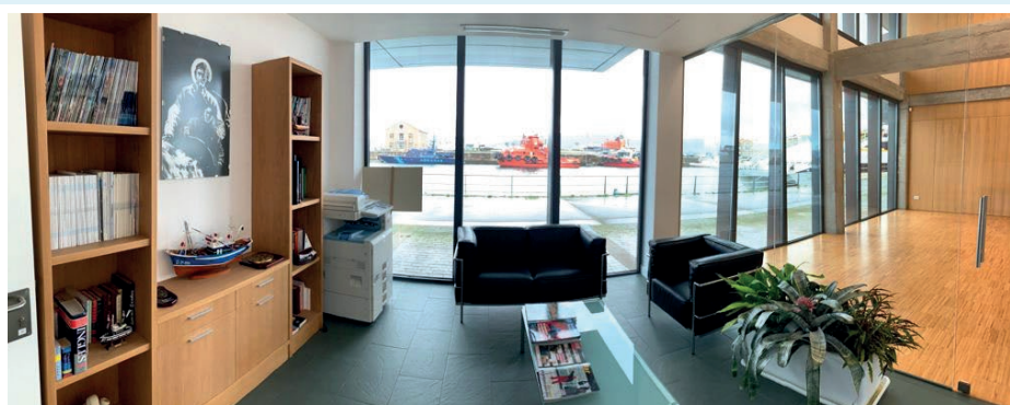
Fotos: Oficinas de Stella Maris en el edificio Portocultura