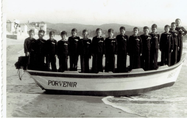
Fotos: Niños acogidos en el Orfanato Nacional Virgen del Carmen