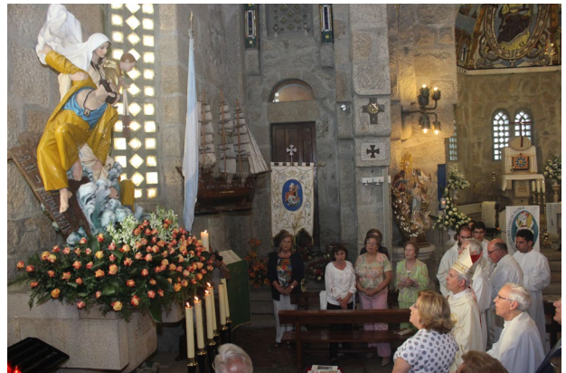
Fotos: Ofrenda del Mar de Panxón en el año 2016