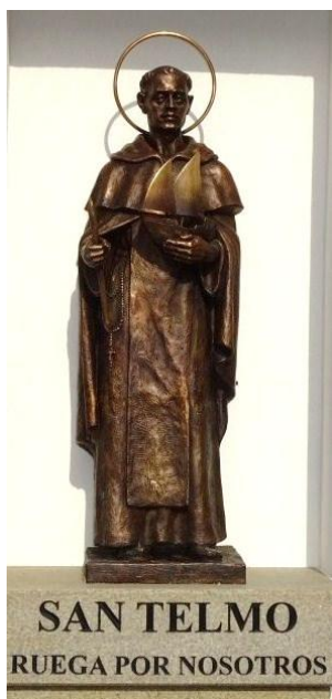
Imagen que se encuentra en la hornacina exterior de la Curia

Dos séculos XVI e XVII poden sinalarse como acontecementos importante: os Sínodos de D. Diego de Avellaneda (1528); a impresión en Salamanca do novo Breviario tudense (1564); novo Sínodo en xullo de 1578; os ataques do corsario Drake ás vilas de Baiona (1587) e Vigo (1589); o agravamento da guerra con Portugal (1640) e a fundación do Convento dos Franciscanos en ui (1684).